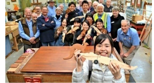
オーストラリアのベリーメンズシド訪問の様子