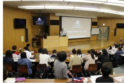
ノバサウスイースタン大学の講師による講義

世界の作業療法をリードする アメリカ 、 カナダ の研究者と交流し、来日の際には最新の研究結果に基づく特別講義を開催しています。2017年4月には、米国のノバサウスイースタン大学から2名の講師を招いて、作業科学や発達障害児の感覚特性に関する講義を受け、ディスカッションを行いました。2016年には、6名の学生が オーストラリア のベリーメンズシドを訪問し、高齢者のもづくりを通じた健康活動の取り組みを学びました。また、1年次生が授業の一環で スコットランド のクイーン・マーガレット大学の学生とメールを交換し、文化が作業に与える影響について考察しました。